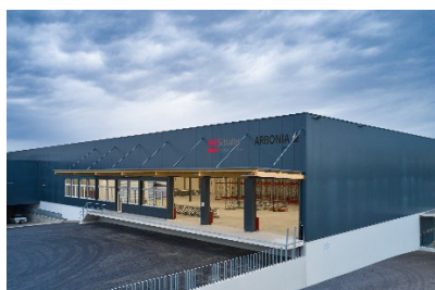
Vista esterna del nuovo capannone logistico